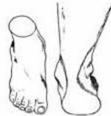
enkel naar binnen

Bij het passen van nieuwe schoenen is het dan belangrijk om eens naar de bouw van je eigen voet te kijken, bijvoorbeeld een hoge wreef of een brede voet. Bij een eventuele standsafwijking van de voet is het dragen van schoenen die enigszins corrigerend werken op deze afwijking raadzaam. Iemand die met de voet iets naar binnen helt kan het beste schoenen kopen die extra steun geven aan de binnenkant van de voet.